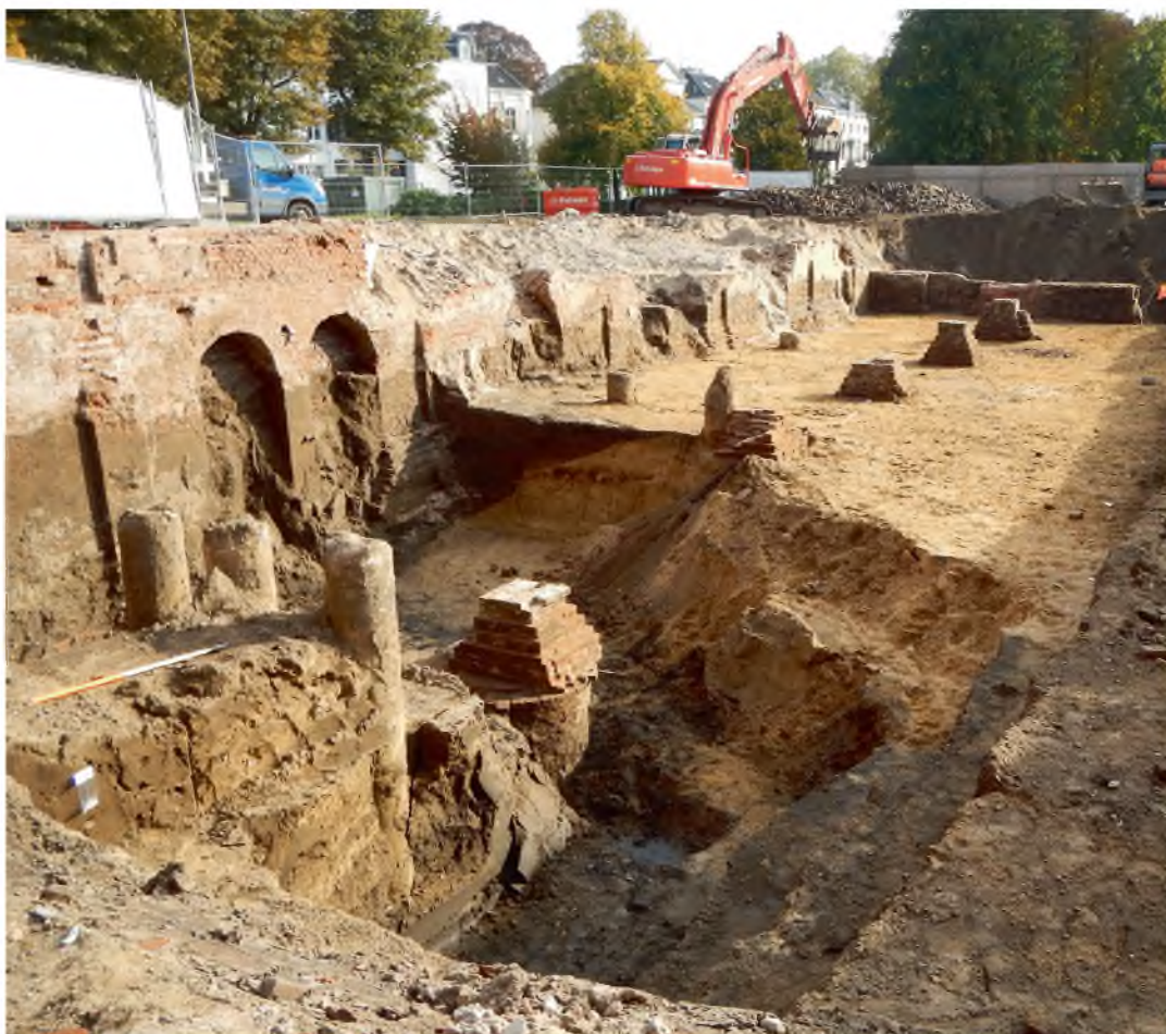
De funderingen van Muis Sacrum, blootgelegd tijdens het archeologisch onderzoek in 2015