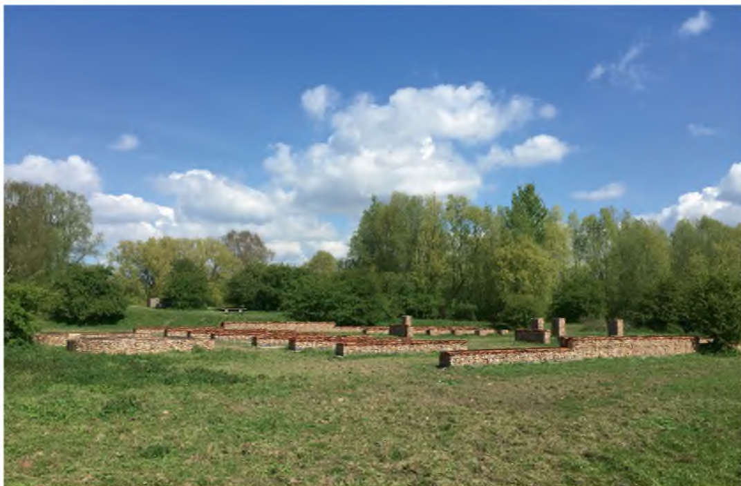
De visualisatie van het castellum Meinerswijk, gezien in noordelijke richting

op de waterbergingsfunctie van de polder. Vandaar dat alleen de ‘met de rivier meelopen- de’ muren zijn gevisualiseerd. De vulling van de gebruikte schanskorven bevat een zeke- re symboliek: de onderste laag zwart beton refereert aan de Bataafse Opstand in 69 na Christus, toen het fort in brand werd gestoken. De middelste laag kalksteen symboliseert de steenbouwfase van het castellum (175-275 n.Chr.) en de bovenste laag van gebroken dakpannen verwijst naar de dakbedekking van het stenen castellum. Informatieborden en doorkijkpanelen vertellen het verhaal en bieden een completer beeld. 36