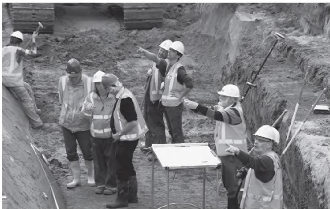
Onder grote belangstelling wordt de opbouw van de Oosterhoutsedijk onderzocht

In 2015 zijn diverse grote en kleinere projecten binnen de gemeente uitgevoerd. Daaronder was het laatste veldwerk in het kader van het jaren durende project ‘Ruimte voor de Waal’, het onderwerp van de studiedag van de Gelderse Archaeologische Stichting in 2016. In 2015 concentreerde het onderzoek zich onder andere op de geschiedenis van de dijken langs de Waal met een profiel door de oude Oosterhoutsedijk, voordat deze afgegraven werd.